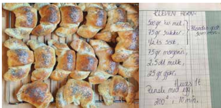
Klevens frøhorn.

Bakeriet ble lagt ned i 1982. Klevens bakeri og konditori ga navn til Konditorveien som går forbi forretningen på vei fra Snippen og