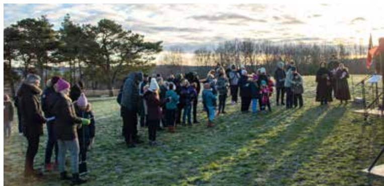
Det har ofte vært trangt om plassen i den vesle kirken julaften. Men i 2020 ble gudstjenestene flyttet ut i parken av smittevern-hensyn. Over 100 fikk med seg en stemningsfull start på julekvelden til tross for kald vind.

Da ordinære gudstjenester, aktiviteter og møter ble umuliggjort i våres måtte kirken tenke alternativt. Gudstjenester, kveldsbønner og konserter har blitt strømmet, i tillegg til telefonkontakt med medlemmer. Nytt av året var utegudstjeneste på julaften. Mange møtte opp, og Lisleby barnegospel deltok med sang.