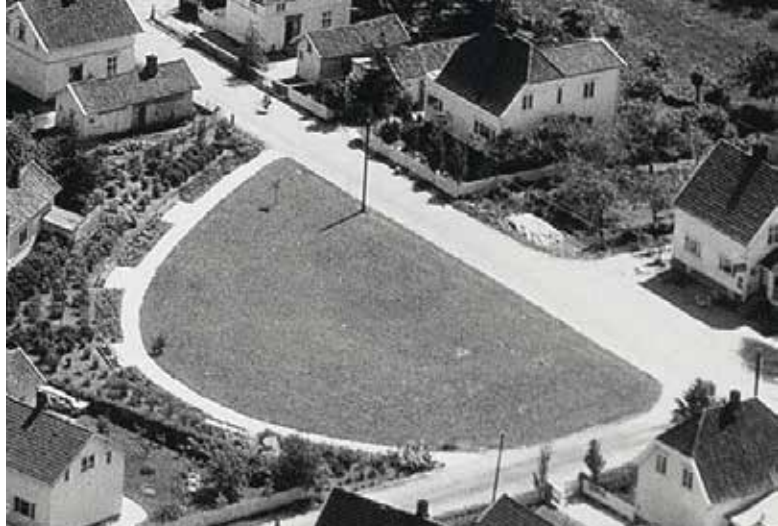
Her ser vi hvordan butikken til Kleven lå ideelt plassert ved den store parken. Bildet er hentet fra boka til Roy.