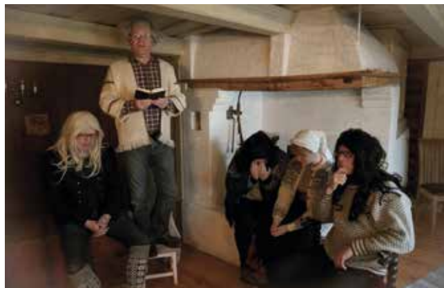
Haugianerne» anno 2021 i Gamlestua. Lurer du på hvem som er hvem, kan du jo sammenligne med bildet av de ansatte på side 2 i menighetsbladet!