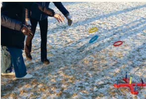
Konfirmanttida byr på mange utfordringer, og lek og læring går hånd i hånd.

Konfirmantene kom i grupper og brukte en time ute i parken ved Gamle Glemmen kirke - i sol, men litt for mange minusgrader. Sammen fylte vi timen til randen med aktivitetsløype,